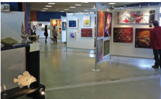
Le 25 e Salon d'automne se déroulera les 22 et 23 novembre, à la fois dans la petite salle de Robien et dans la maison de quartier.

1. Galette littéraire. Le jeudi 13 novembre, en partenariat avec le festival Noir sur la ville, le Car accueillera le romancier Jean-Hugues Oppel, pour une « Galette littéraire ». Rendez-vous à 19 h 30 à la crêperie « Bleu marine » pour le repas ; rencontre à 21 h. Réservation au 02.96.94.26.73.